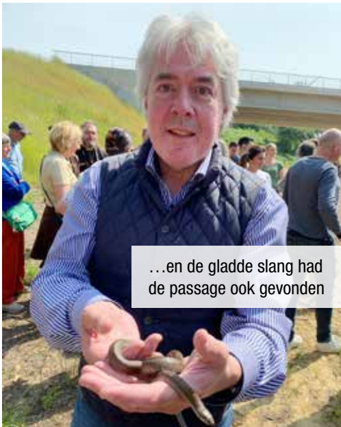
...en de gladde slang had de passage ook gevonden