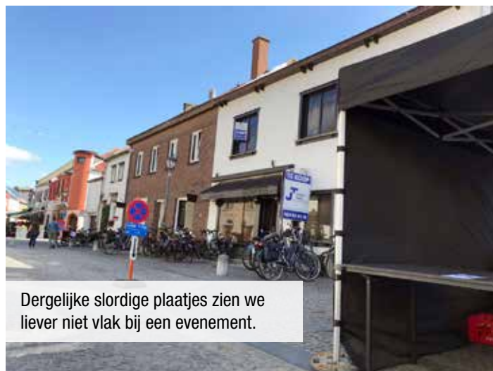
Dergelijke stordige plaatjes zien we liever niet vlak bij een evenement.

Bij de publieksbevraging naar de kwaliteit van de plaatselijke fietsinfrastructuur, -beleving en -communicatie krijgt Dilsen-Stokkem een globale score van acht op tien. Een terechte beloning voor de vele inspanningen die al geleverd zijn. Vele gewestwegen zijn of worden momenteel uitgerust met verbrede fietspaden. Schoolomgevingen zijn overwegend autovrij of auto-luw. De fiets-faunapassage Vossenbergh (zie elders in het HAH-blad) is een pareltje.