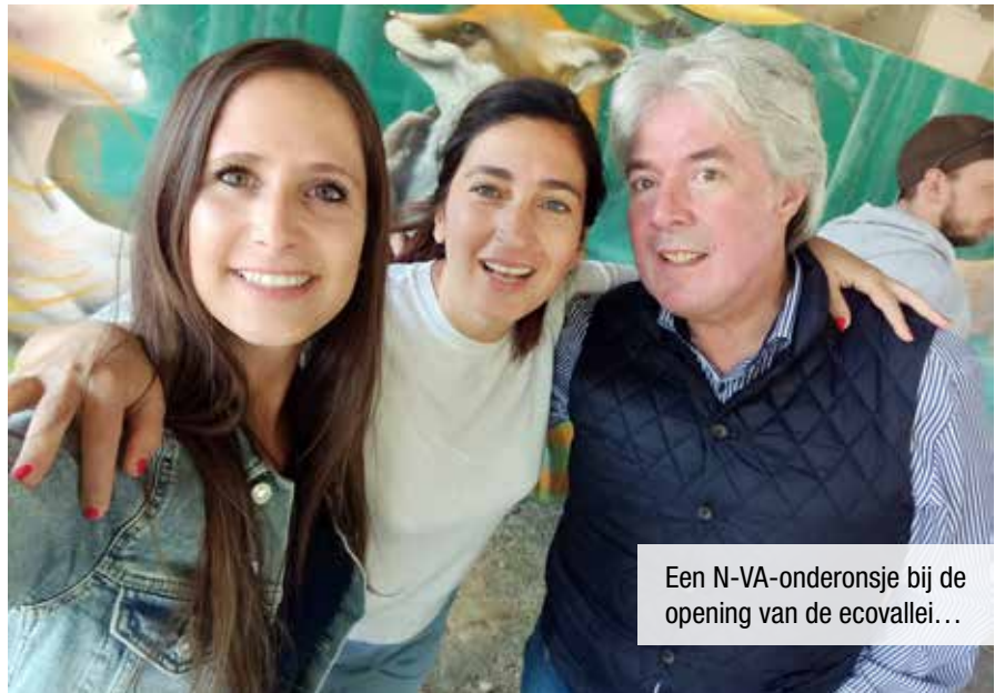
Een N-VA-ondersje bij de opening van de ecovallei...